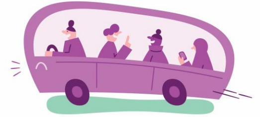
Påstigende pr time